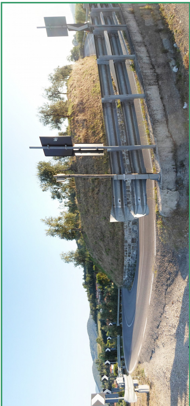
Tornante oggetto dell'intervento